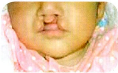
ปากแหว่งสองข้าง