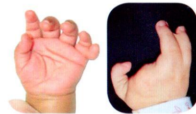
นิ้วมือเกิน หรือ นิ้วด้วน