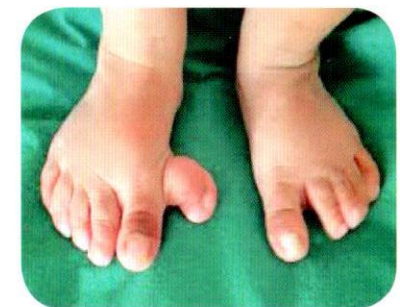
นิ้วเท้าติดกันหรือนิ้วเท้าเกิน