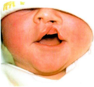
ปากแหว่งข้างเดียว