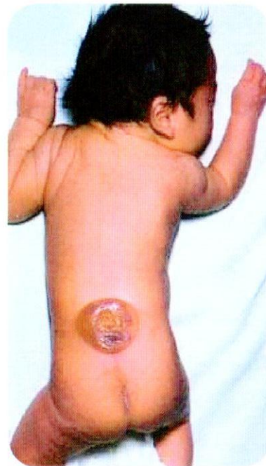
กระดูกสันหลังไม่ปิด