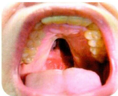
เพดานโหว่